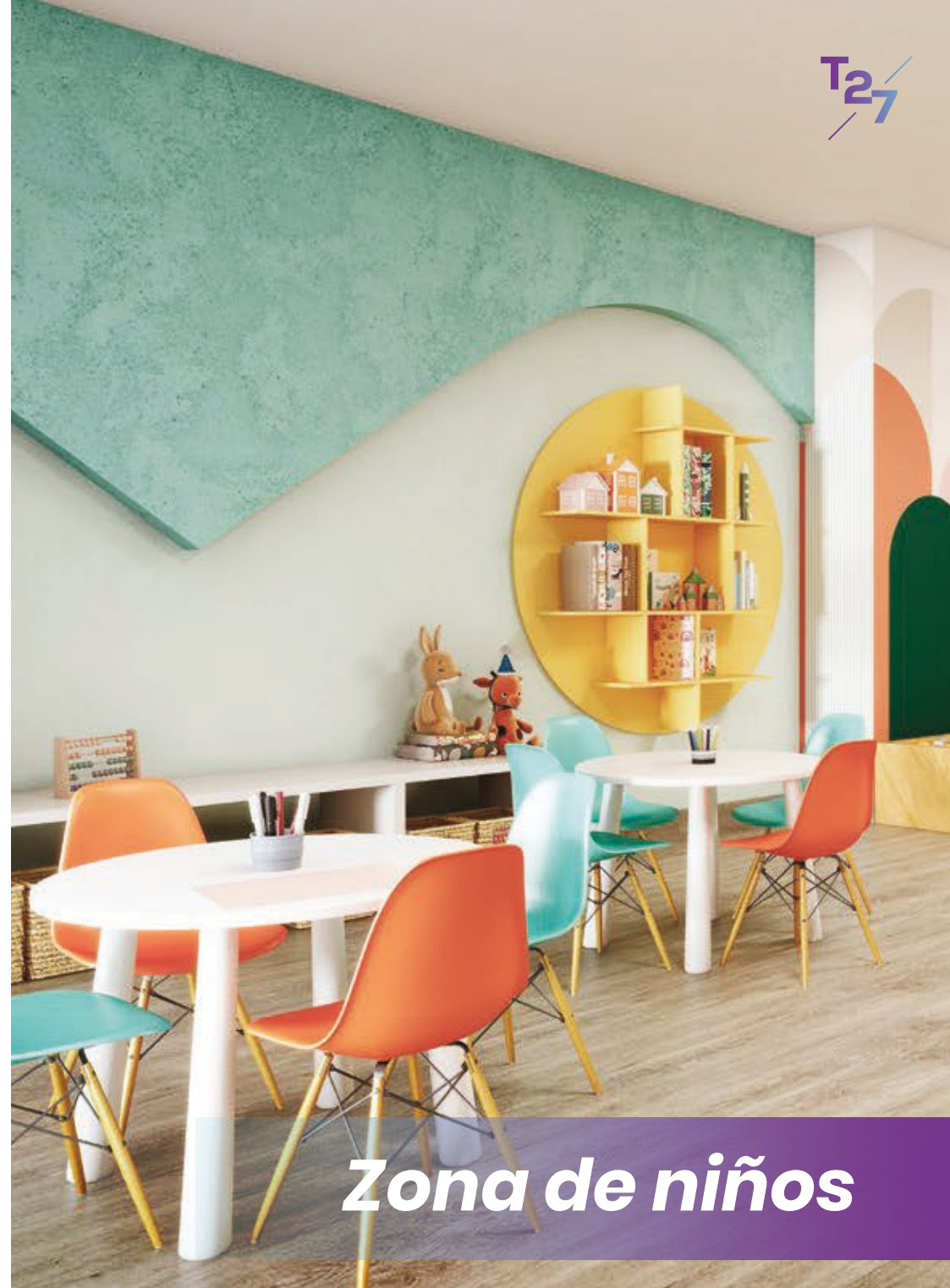
Zona de niños