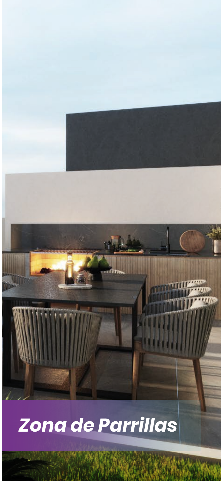
Zona de Parrillas